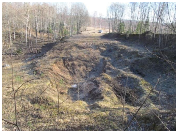
Skats no „amfiteātra” puses uz ceļu un pāri tam otrā pusē