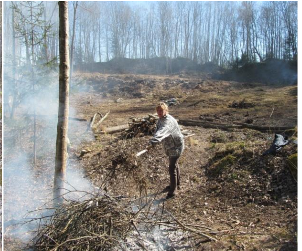
Krūmu ciršana un teritorijas attīrīšana pirms līdzināšanas