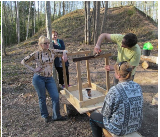
Kad lielākā daļa talcinieku aizbraukuši, pietiek vēl spēka nokrāsot galdu!