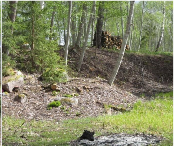
Tādi ir aprīļa talku rezultāti.