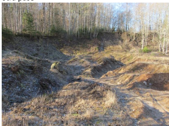
Grants ņemšanas vieta un atkritumu izgāztuve.